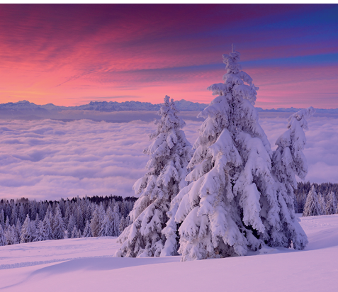
Ambiance matinale au-dessus de la mer de brouillard.