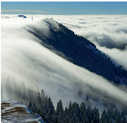
Sur la crête du Chasseron.