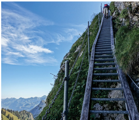
Les grands escaliers qui mènent à Naye d'en Haut.