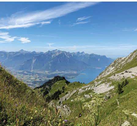
Vue spectaculaire sur le Lac Léman et le plateau.