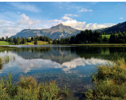
Prairies, marécages et forêts entourent le lac de Lauenen.

Restaurant Lauenensee, 033 765 30 62, www.lauenensee.net