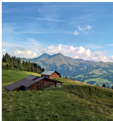
En chemin de Hinderi Wispile à Chrine: vue sur le Louwenehore et le Giferspitz.