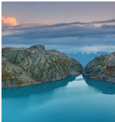
Le magnifique Wildsee avec son couleur irréel.