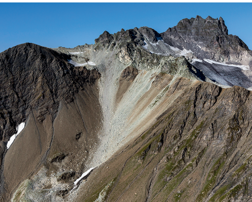
Une fine bande blanche traverse la paroi rocheuse au pied du Pizol: le calcaire de Lochsite.

Hôtel Gemse, 081 723 17 05, www.weisstannen.ch