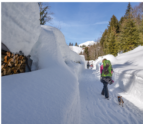
Le soleil chauffe bien parfois, mais il y a également des tronçons ombragés.