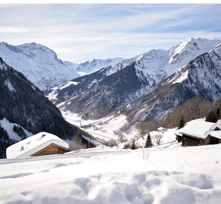
Une épaisse couche de neige et un panorama grandiose.

Auberge de montagne Edelwyss, 055 642 24 26, www.berggasthaus-edelwyss.ch