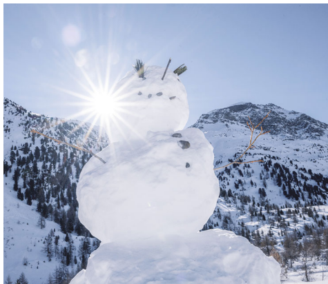
Il n'y a pas que des humains qui s'arrêtent dans le Val Morteratsch.