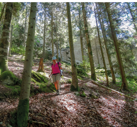
Parfois, on traverse la forêt...

On accède à Bassecourt en train depuis Bienne ou Bâle. D'Undervelier, on retourne à Bassecourt en bus.