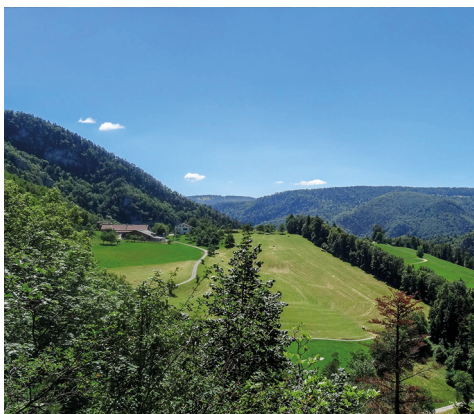
...mais bientôt les vues imprenables s'offrent à vous.