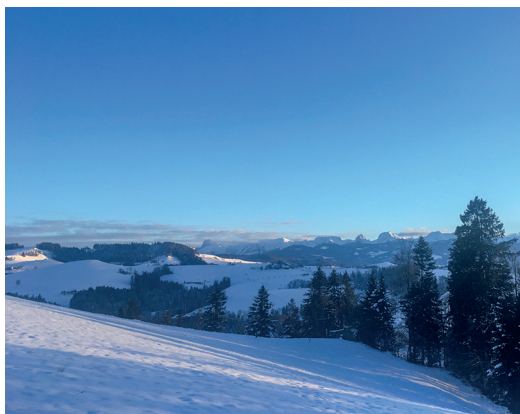
Vue sur le Gantrisch depuis Borisried.