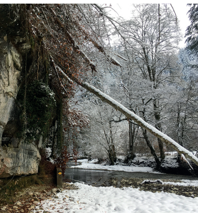
Parois de grès et forêt sauvage dans les gorges de la Schwarzwasser.

Restaurant Bären Oberbalm, 031 849 01 60, baerenoberbalm.ch