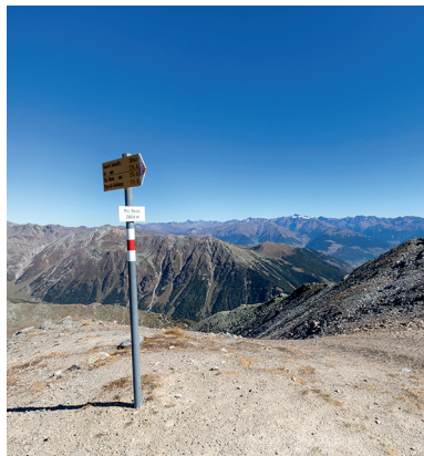
Grands espaces et vue imprenable depuis le Piz Terza.