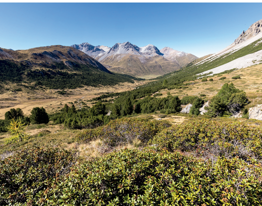
Vue sur la vallée de la Clemgia, peu avant le Pass da Costainas.