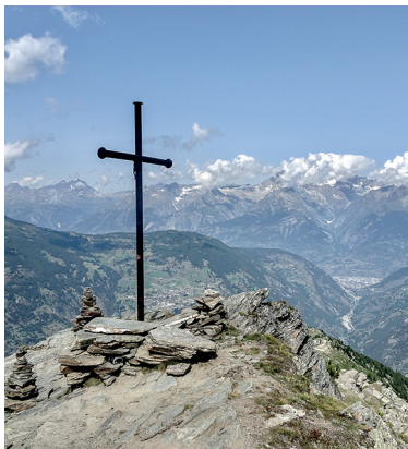
Au sommet du Wannehorn.