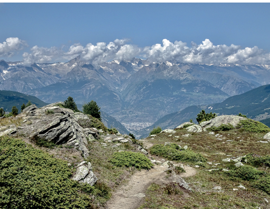
Vue sur Viège et la vallée.

Restaurant de montagne familial Hannigalp, 027 955 60 20, www.graechen.ch