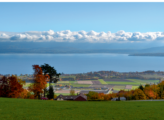
Vue sur le lac Léman et la rive française.

On accède à Gimel en bus depuis Allaman, localité située sur la ligne ferroviaire Lausanne-Genève. Retour en bus de Gilly à Rolle. Auberge de Gilly, 021 824 12 08, Gilly, www.aubergegilly.ch