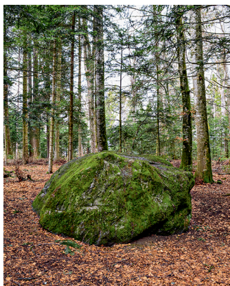
Bloc erratique charrié par le glacier du Rhône près du lac Léman.