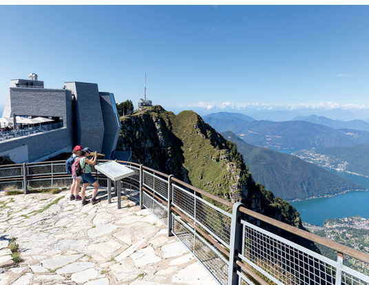
Superbe vue sur le Tessin depuis la plate-forme rocheuse qui accueille la «fiore di pietra» de Mario Botta.

Monte Generoso, 091 630 51 11, www.montegeneroso.ch