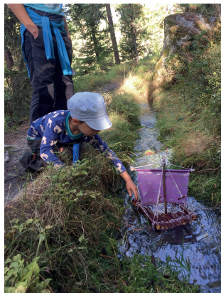
Les bisses invitent au jeu. Autant en profiter.