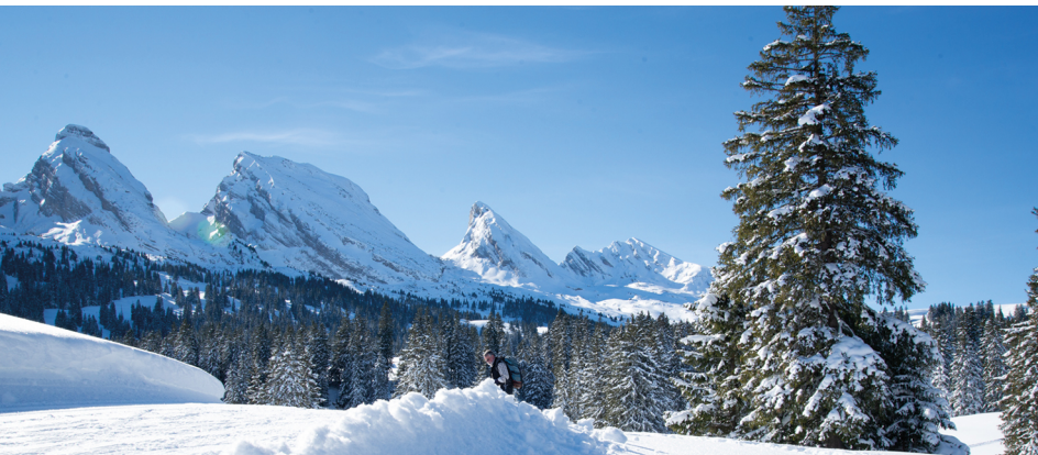
Le paradis hivernal de Selamatt.

Zinggen Pub, 071 999 13 30, toggenburg.swiss