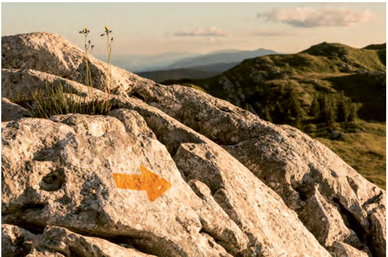
Des balisages intermédiaires entretenus et clairement visibles permettent même aux randonneurs qui connaissent bien le terrain de s'assurer qu'ils sont sur le bon chemin (Vallée de Joux, VD).