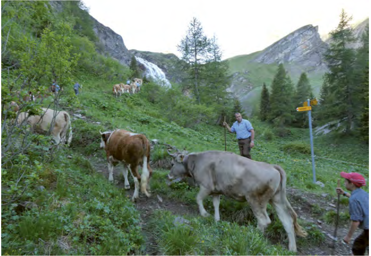
La garantie du libre accès aux chemins de randonnée pédestre est définie avec les propriétaires fonciers et diffère selon les cantons (Engstligenalp, BE).