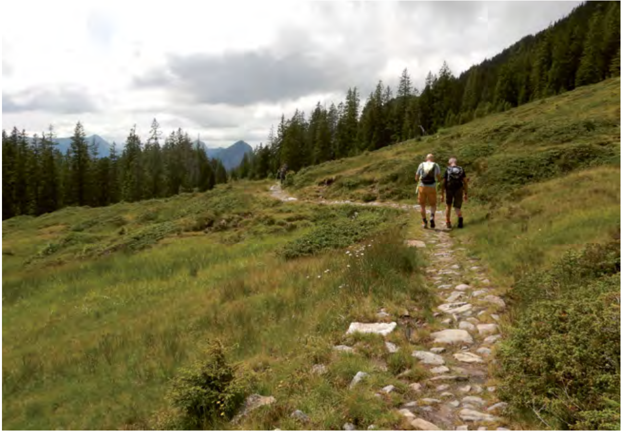
Selon l'art. 3 LCPR, les chemins historiques doivent être intégrés dans le réseau des chemins de randonnée pédestre. Il en va de même pour d'autres inventaires cantonaux et nationaux, qui contribuent à offrir des randonnées contrastées et variées (Alpnach, OW).