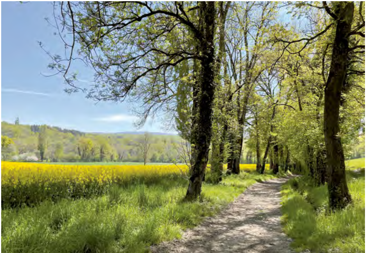
Chemin proche de l'état naturel dans une zone agricole (Chancy, GE).