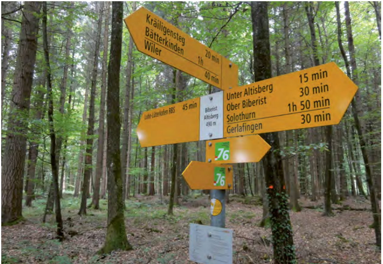
Malgré l'utilisation croissante d'outils de navigation numériques, les deux tiers des randonneurs considèrent toujours les indicateurs de direction et les balisages comme les repères les plus importants pour s'orienter. Les itinéraires de La Suisse à pied sont signalés par des champs verts, aux emplacements des indicateurs de direction renseignant sur la destination (Biberist Altisberg, SO).