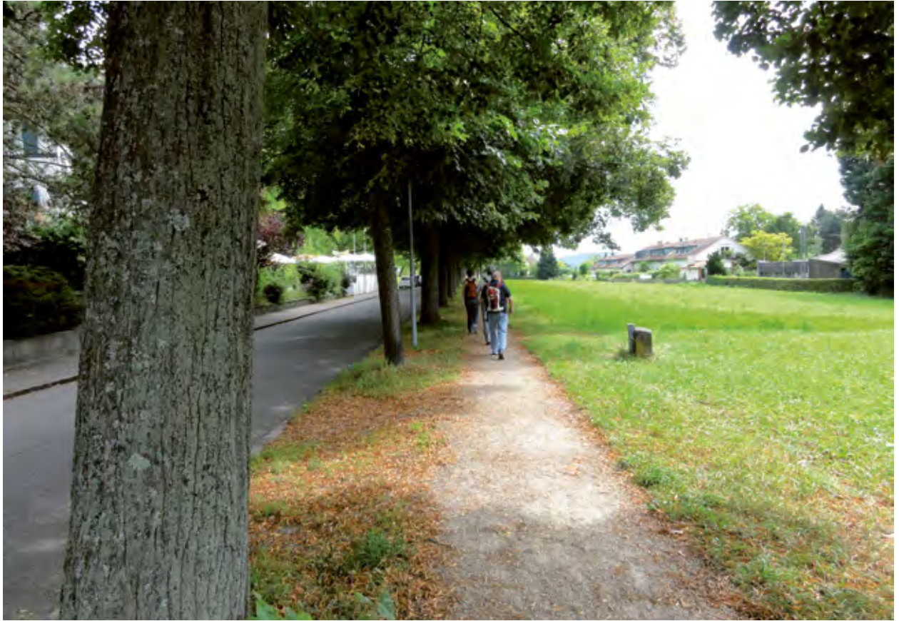
Les chemins de randonnée pédestre proches de l'état naturel constituent également une infrastructure essentielle pour les personnes en quête de détente au sein des villages (Bâle, Dreiland).