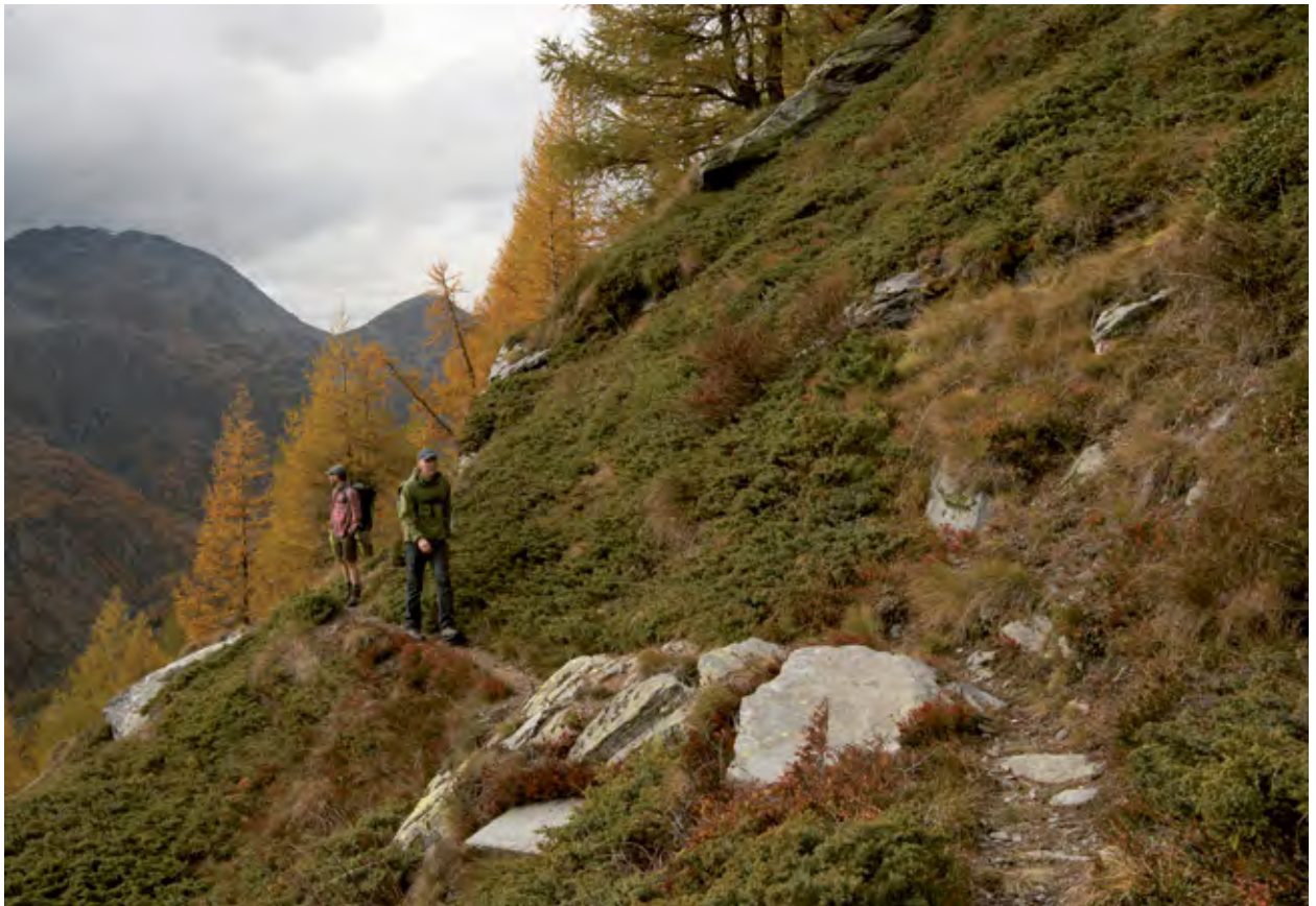
Un chemin intégré dans le relief est naturellement varié et offre sans cesse de nouvelles perspectives (Simplon, VS).