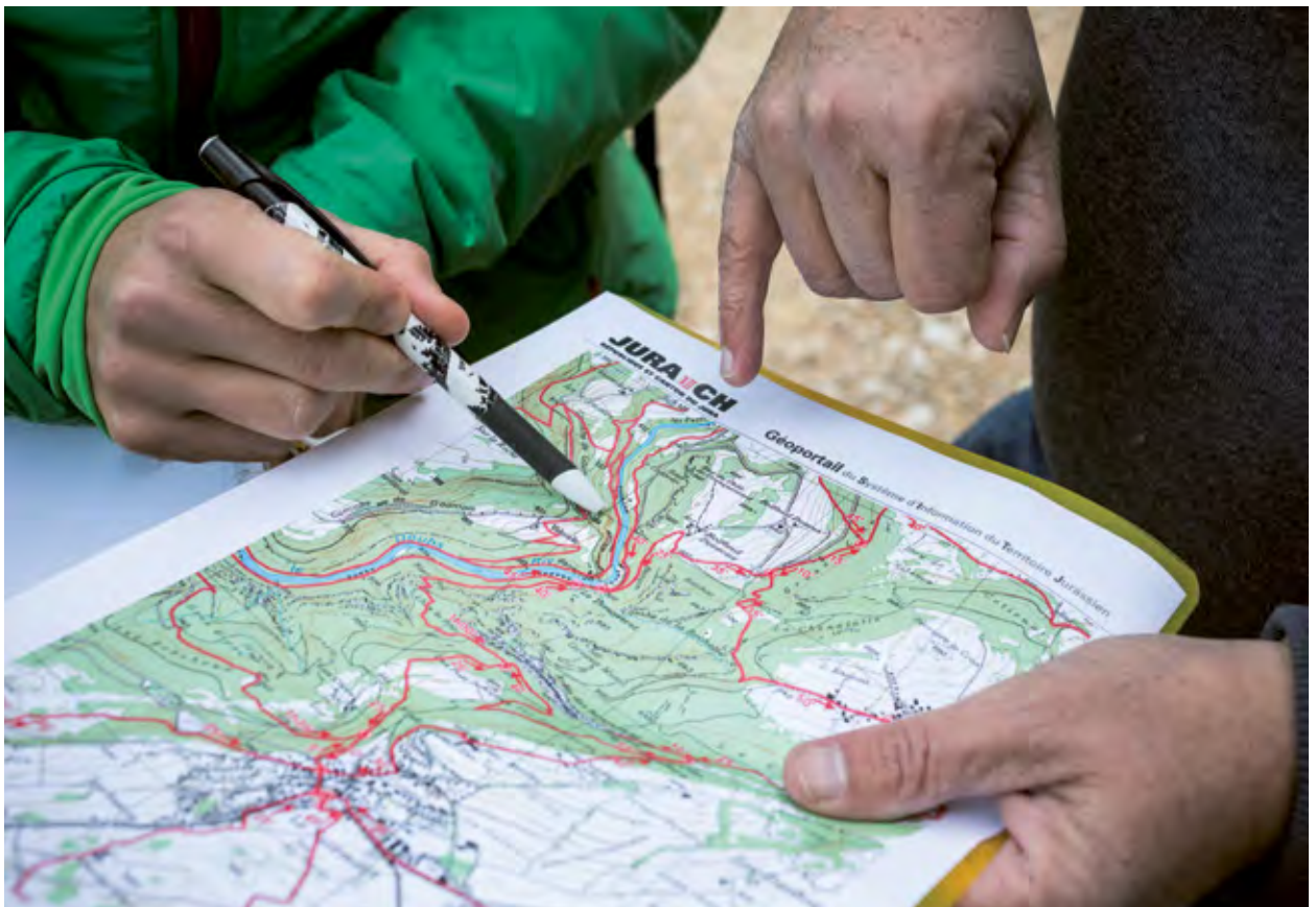
Lors de la planification et de l'entretien du réseau de chemins de randonnée pédestre, il convient de tenir compte de tous les intérêts ayant des effets sur l'organisation du territoire et d'intégrer suffisamment tôt les potentielles évolutions et opportunités (canton du Jura).