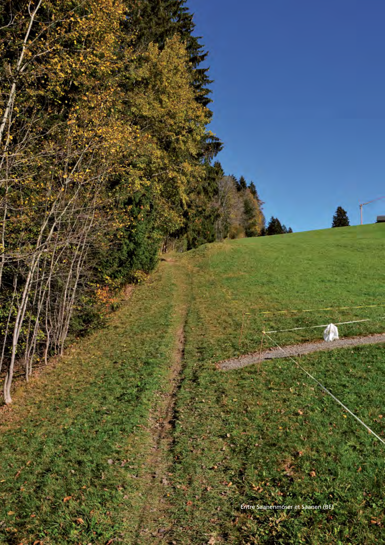
Entre Saanenmöser et Saanen (BE)