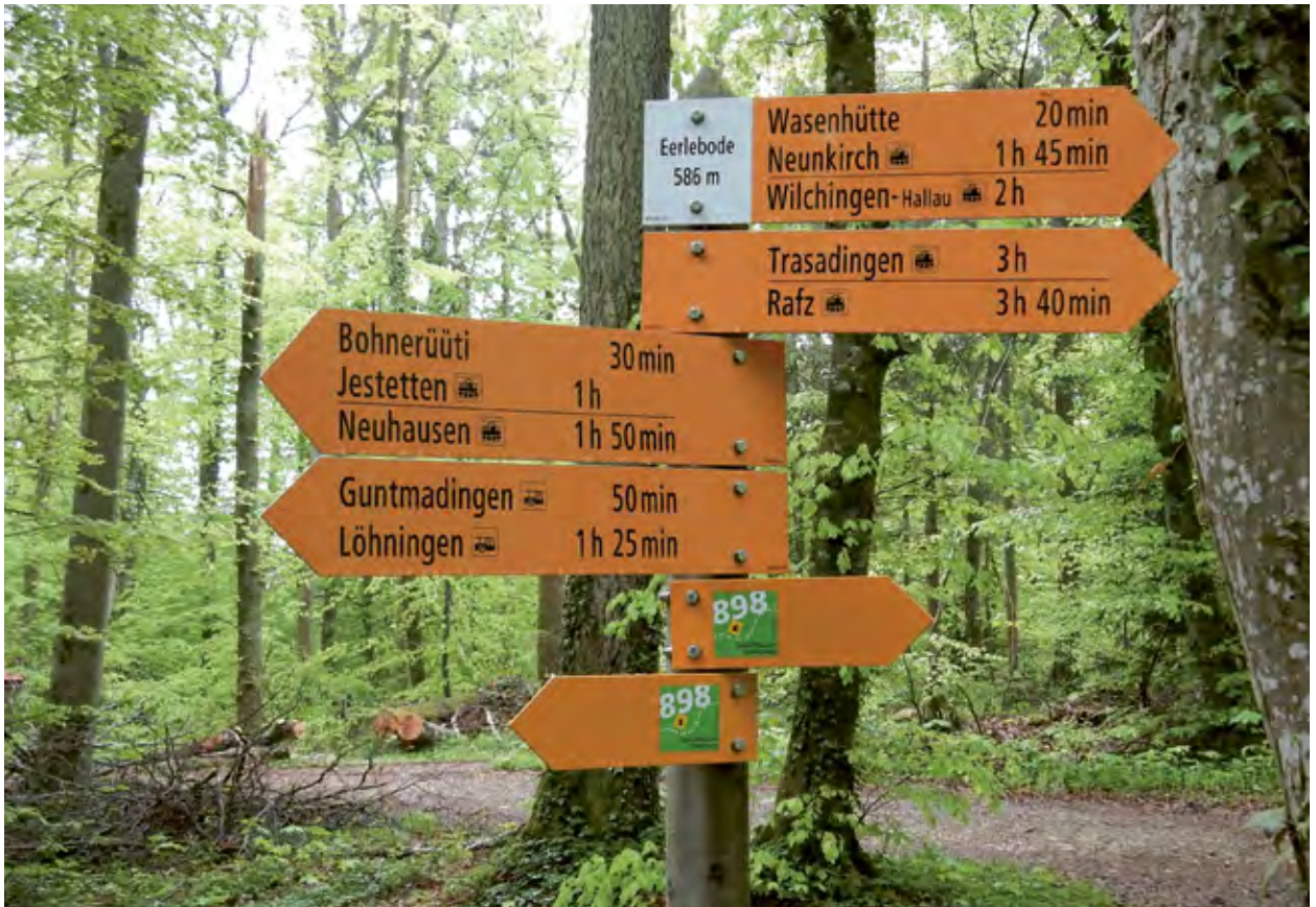
Les symboles pour le train, le bus, les remontées mécaniques ou le bateau indiquent les destinations de randonnée desservies par les transports publics et les arrêts les plus proches. Ces repères d'orientation permettent d'écourter ou de prolonger les randonnées (Erlebode, SH).