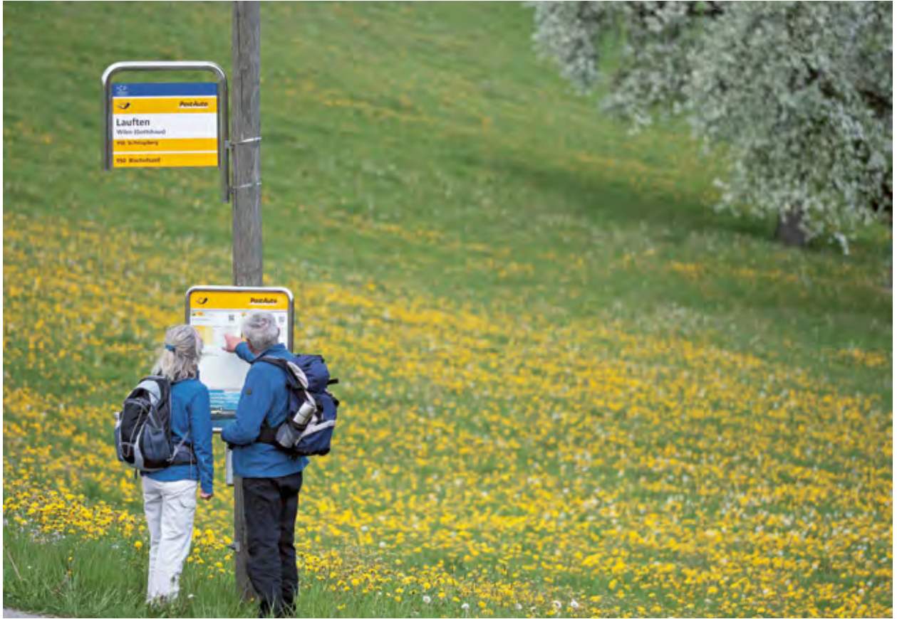
Un voyage aller-retour sans encombre augmente l'attractivité et la qualité de délassément d'une région de randonnée (Laufen, TG).