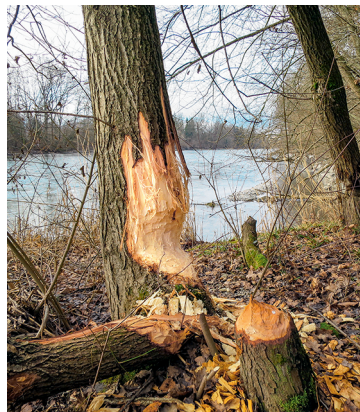
Hier waren Biber am Werk.