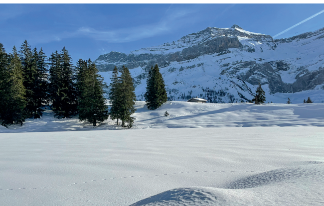
Vom Ufer des Lac Retaud hat man eine schöne Aussicht auf das Oldenhore.

Restaurant Col de Pillon, 024 492 10 00, www.glacier3000.ch