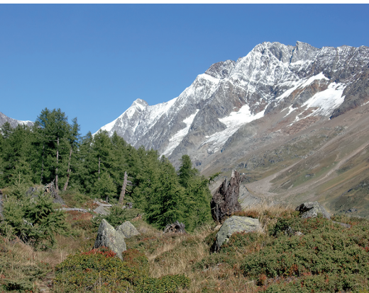
Auf dem Löttschberg-Panoramaweg mit Blick aufs Schinhorn.

Hotel Fafleralp, 027 939 14 51, www.fafleralp.ch