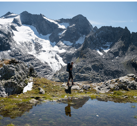
I laghi di montagna sono predominanti in questa escursione.

Capanna Basodino, 091 753 27 97, www.capanna-basodino.ch , www.caslocarno.ch Albergo-Ristorante Robièi, 091 756 50 20, www.robiei.ch