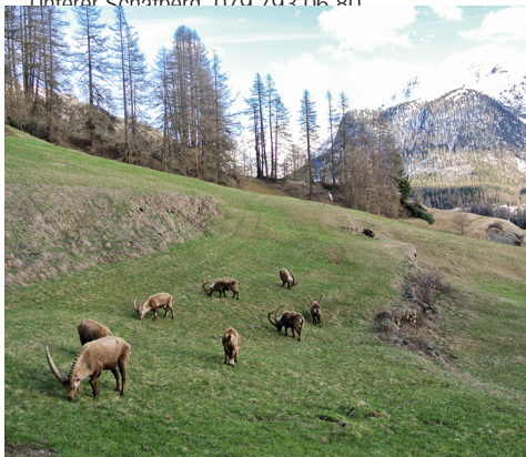
Seelenruhig grasen die Steinböcke und scheren sich nicht um Beobachter.