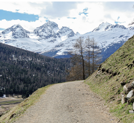
Imposante Bergkulisse garantiert.