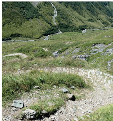
Breite Säumerwege machen den Aufstieg auf den Septimerpass angenehm.