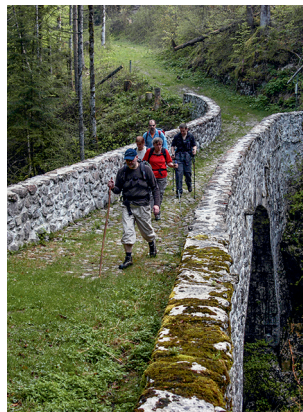
Die Pont du Pontet.