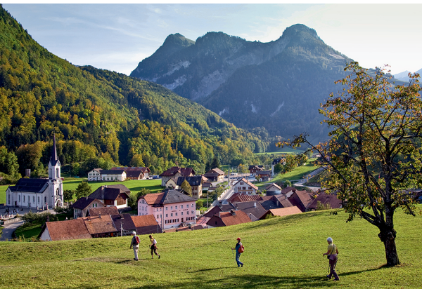
Montbovon mit Blick auf den Dent de Corjon.

Hotel-Restaurant La Croix de Fer, Allières, 026 928 16 06, www.lacroixdeferaliieres.ch Molkerei Montbovon, eigene Produktion, 026 928 11 43, www.laiterie-montbovon.ch