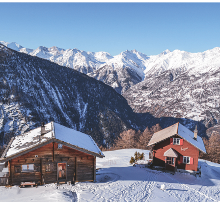
Blick von Gspion in die Augstbordregion.

Hotel Restaurant Alpenblick, Tel. 027 952 222 21, www.alpenblick-gspion.ch