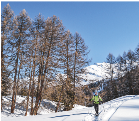
Reizvoller Abschnitt auf dem Waldegga-Trail.