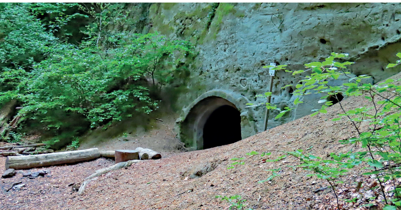
Früher wurde in der 5 Minuten-Höhle Bier und Eis gelagert.

Restaurant Burg Hohenklingen, 052 741 21 37, burghohenklingen.com