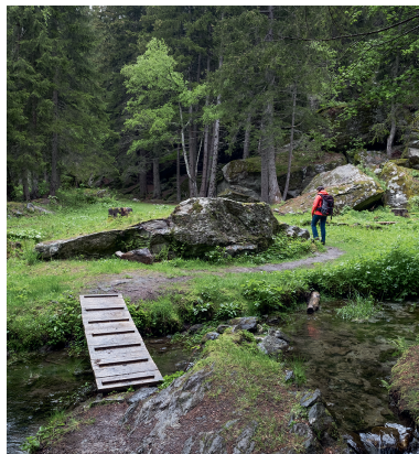
Lo spiazzo Valpurga in una radura del bosco delle streghe nel Blindtälli è un luogo mistico.