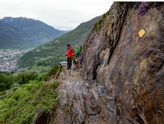
Tra Hegdorn e Geimen si hanno splendide vedute a valle fino a Briga.

World Nature Forum, Centro informazioni Naters, 027 924 52 76, www.jungfraualesch.ch Mountain-Café "Schwinlibar", Blatten, 079 342 73 79, www.schwinlibar.ch