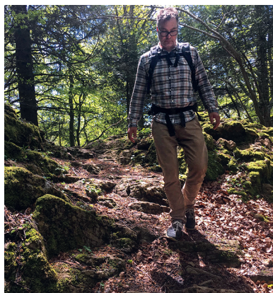
Der Wanderer kommt sich auf dieser Strecke angenehm einsam vor.