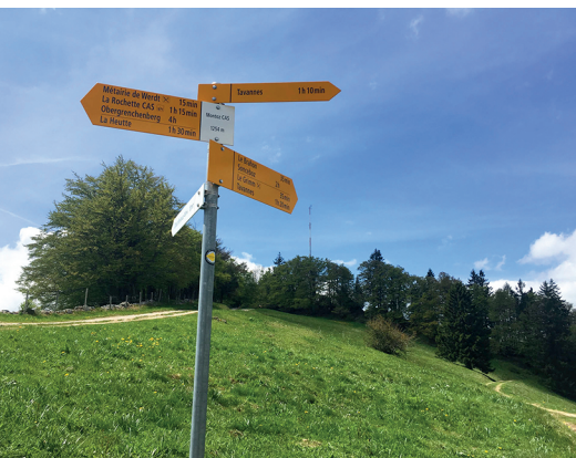
Höchster Punkt der Wanderung: bei der Montoz-Hütte.

Restaurant Wertberg, Métairie de la Wertberg: 032 481 17 86, www.restaurant-wertberg.ch