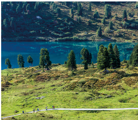
Der Engstlensee ganz in Türkis.