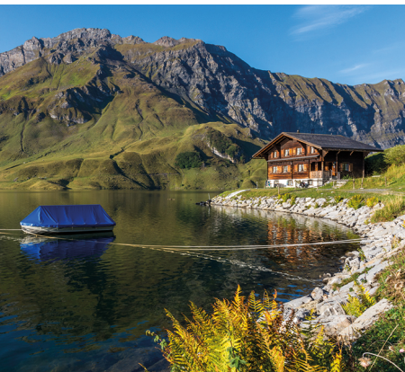
Morgenstimmung am Melchsee.

Erreichbar ist Melchsee-Frutt mit der Luftseilbahn ab Stöckalp. Dank vielen Bahnen kann die Marschzeit bei Bedarf von rund 6 Stunden auf unter 1.5 Stunden reduziert werden. Von der Melchsee Frutt zur Tannalp fährt der Fruttli-Zug.