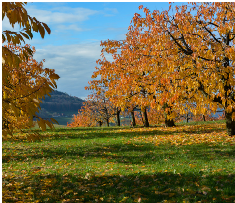
Im November leuchtet das Laub der Kirschbäume in den buntesten Farben.