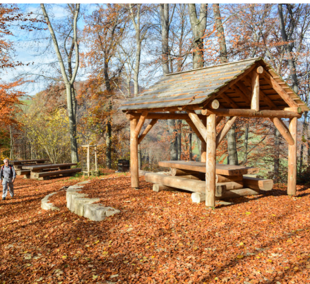
Eine traumhafte Feuerstelle am Fusse der Homburg lädt zum Verweilen ein.