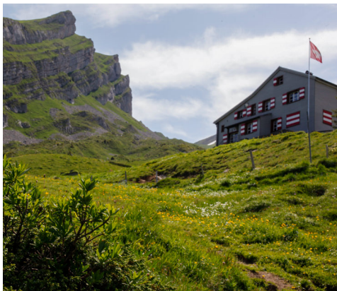
Flach zieht sich der Weg hinüber zur Brisenhütte des SAC.