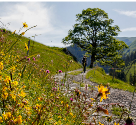
Blühende Alpwiesen wohin man schaut.

Bei Bielhütten wird ein Tipi-Dorf mit Übernachtungsmöglichkeit und Alpeizli betrieben: Silbe Käslin, 079 643 23 75, www.tipi-dorf.ch