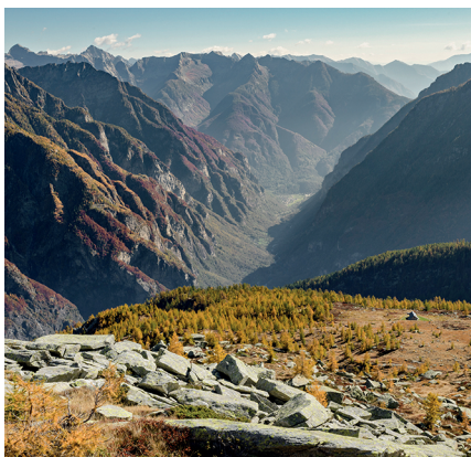
Le Alpi della Val Bavona sembrano quasi dolci: l'Alpe di Solöгна.