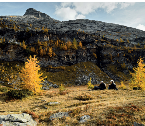
Momenti di quiete autunnale nella torbiera del Piano delle Creste.

Ristorante Basodino, San Carlo, 091 755 11 92 Rifugio Piano delle Creste (custodito fino a metà settembre, poi autogestito), 091 755 14 14, www.sav-vallemaggia.ch