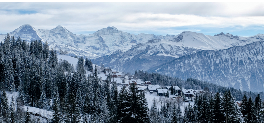
Die Häuser von Waldegg, dem Ziel der Wanderung.

www.hotelrestaurantreginabeatenberg.com/