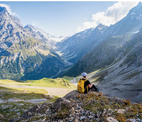
Pause im Aufstieg zum Lötscepass mit Aussicht auf das wilde hintere Gasteretal.

Berghotel Steinbock, 033 675 11 62 www.steinbock-gasterntal.ch Lötchenpasshütte, 027 939 19 81, www.loetschenpass.ch/die-huette Gasthaus Kummenalp, 027 939 12 80, www.kummenalp.ch