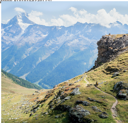
Im Abstieg nach Ferden: der Weg wechselt von steinig-alpin zu saftig-grün.