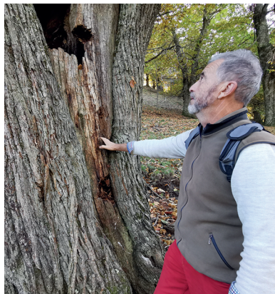
Selve castanili, con alberi in parte secolari.