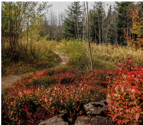
Die Vegetation hat nordische Züge.