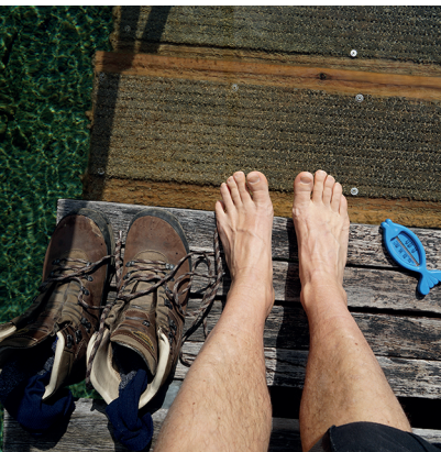
Mutige ziehen ihre Schuhe aus und steigen ins eiskalte Nass.