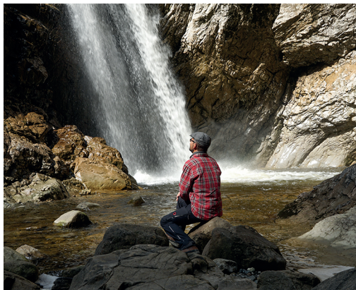
Am Ziel: Der Wasserfall im Chessloch.