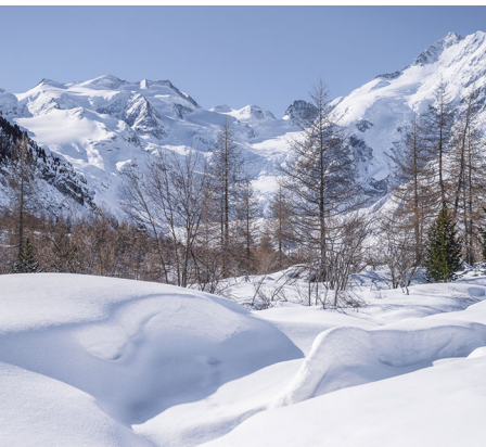
Die Anzahl Bäume nimmt in der Nähe des Gletschers ab.

Erreichbar ist Pontresina, Morteratsch (Hotel) stündlich mit dem Zug ab Chur, via Samedan und Pontresina. Gletscher Hotel Morteratsch, +41 81 842 63 13,