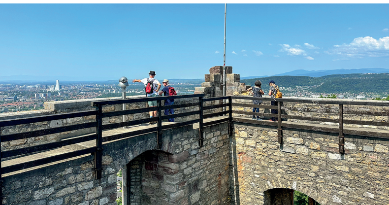
La veduta dalla torre del castello centrale di Wartenberg è grandiosa.

Lindenbeizli Schauenegg, +41 61 906 27 27, www.zumschauenegg.ch