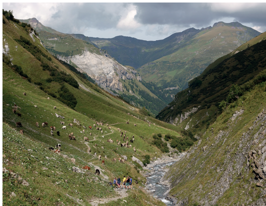
Der Abstieg nach Vorsiez ist sanft.