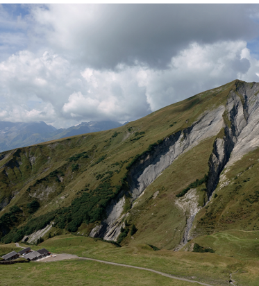
Auf dem Foopass: Bäche haben tiefe Gräben in den Berg gefressen.

Alpwirtschaft Alp Siez, Vorsiez, 081 723 17 48, www.alpsiez.ch