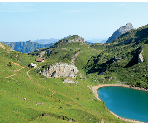
Einkehren in der Alp Spilau mit kühlem Bad im Spilauer Seeli.

Bus nach Riemenstalden (Käppelberg), telefonische Reservation obligatorisch, 041 820 32 55 oder 079 249 47 02, www.riemenstalden.com Alp Spilau, 079 567 45 64, www.alp-spilau.ch Bergrestaurant Oberaxen, 041 870 93 12, www.oberaxen.ch