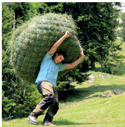
Auf dem Wildheupfad schleppen die Bauern schwere Netze mit Heu.