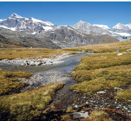
Prächtige Sicht durch das Ofental zu den Viertausendern mit dem Dom ganz rechts.

Hotels und Restaurants in Saas-Almagell.