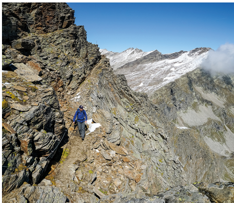
In der exponierten Querung zur Jazzilücke.