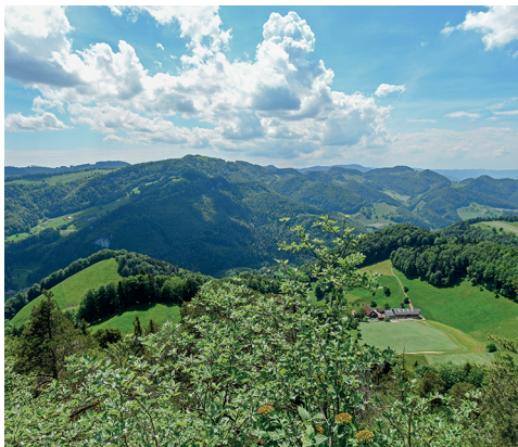
Vue sur le sud-ouest depuis le Hirnichopf.