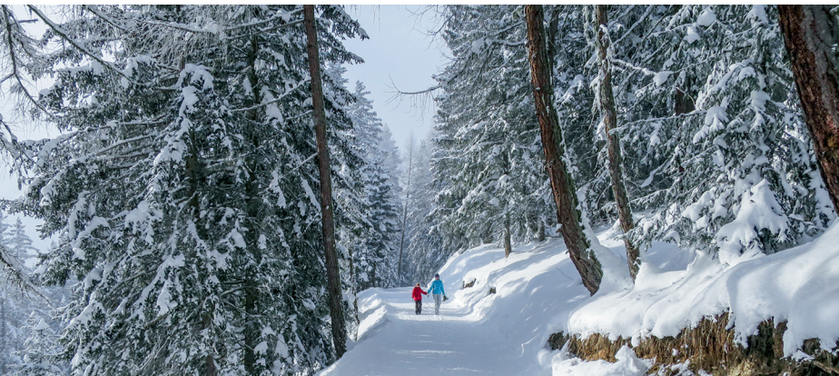
Märchenhafter Winterwald bei Vermala.

CMA SA, 0848 22 10 12, www.crans-montana-aminona.com Cave de Colombire, 079 220 35 94, www.colombire.ch