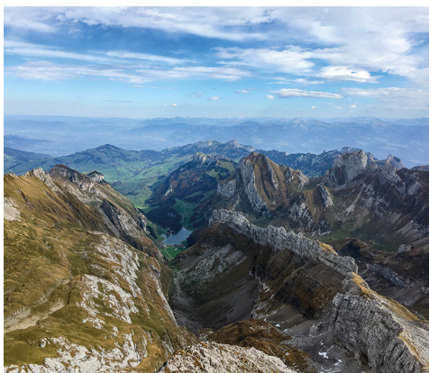
Aussicht vom Gipfel auf den Seelapsee.