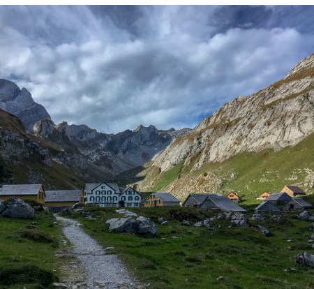
Meglisalp, ein guter Ort für eine Pause vor dem Gipfelanstieg.