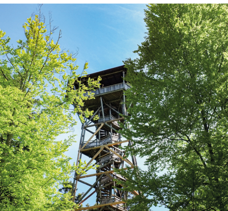
Tutto in vista dalla torre panoramica Lorenchopf.

Ristorante Tobelhof, Tobelhofstrasse 236, 8044 Zurigo, 044 251 11 93, www.tobelhof.ch