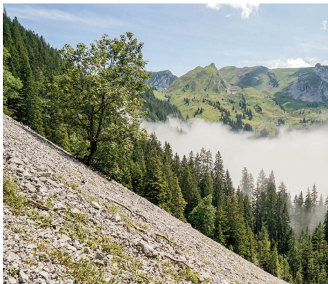
Sicht vom steilen Aufstieg zum spitzen Schinberg (links) und zum Risetenstock dahinter.