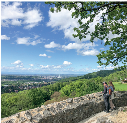
Dai ruderi del castello di Dorneck si gode di una veduta su Basilea.