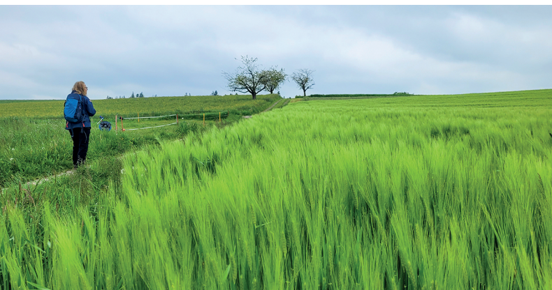
Una tranquilla passeggiata lungo campi e prati fioriti appena fuori dall'abitato di Gondiswil.

Gasthof Bären, Madiswil, 062 957 70 10 www.baeren-madiswil.ch/