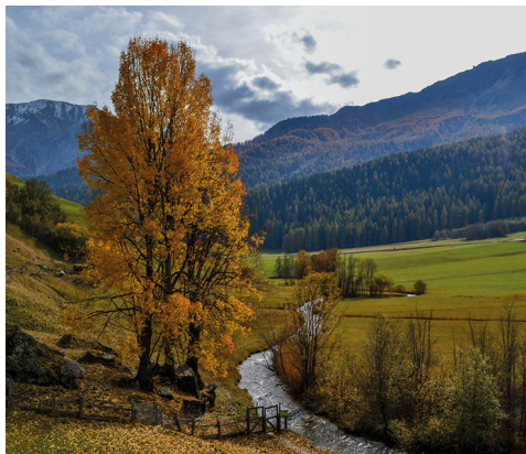
A Fuldera lungo il Rom.