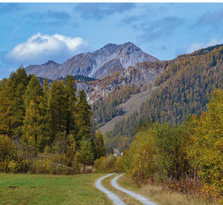
Sulla strada tra Tschier e Fuldera.

Hotel Ofenpass, Tel. 081 858 51 82, www.ofenpass.ch