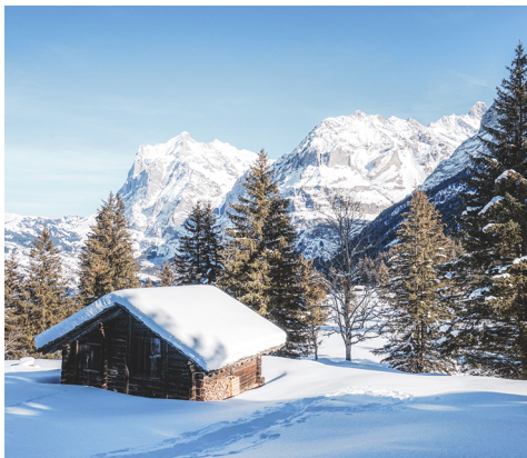
Kurz vor der Brandegg sind auch Wetterhorn (links) und Schreckhorn (rechts noch knapp) zu sehen.