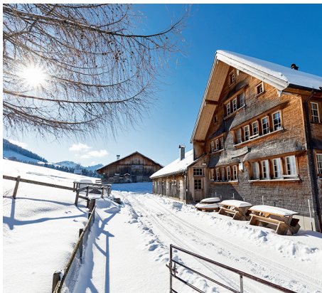
Am Ziel kehrt man gerne in der Bergwirtschaft Blattendürren ein.